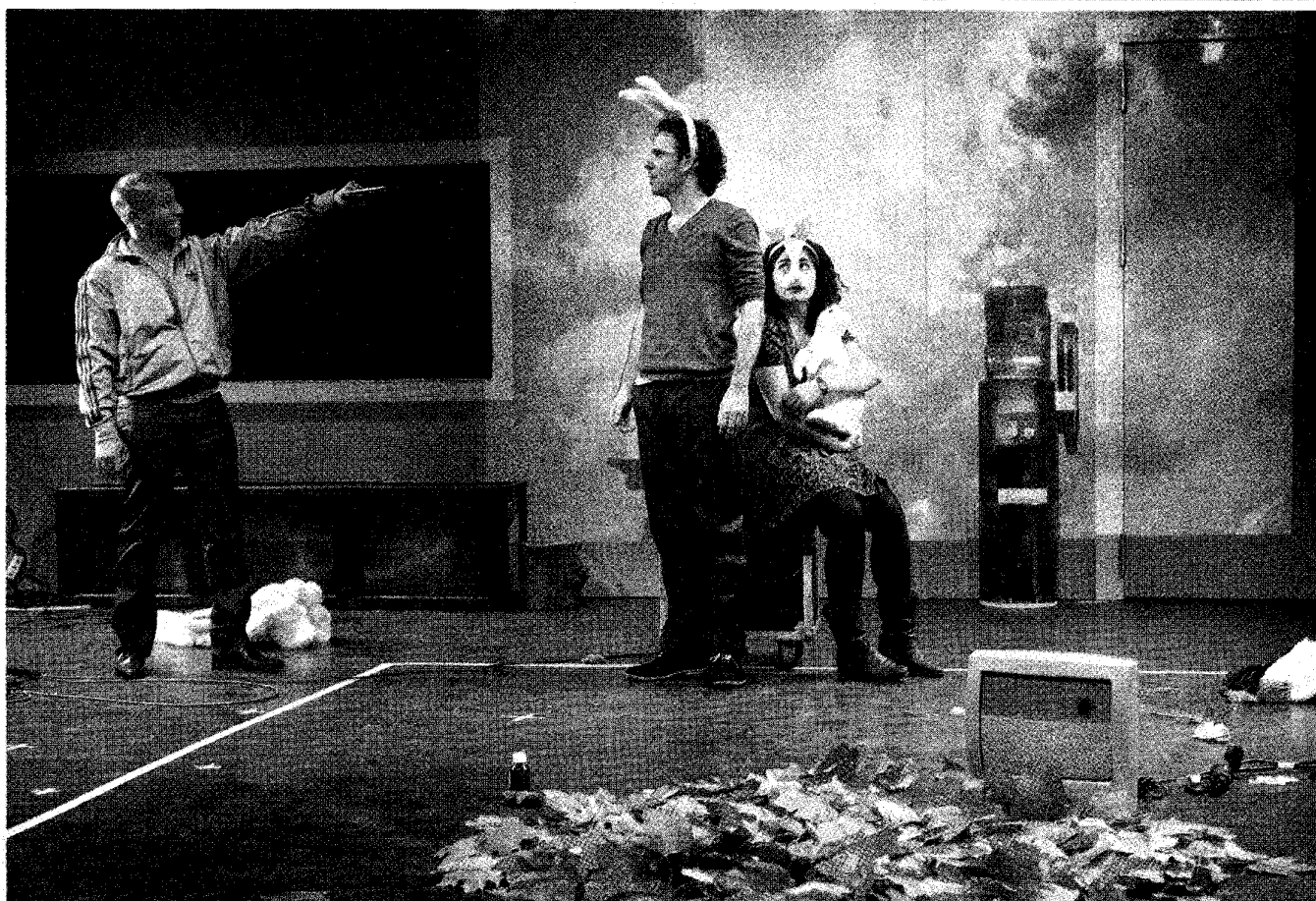
Theatergroep MAX repeteert Nacht , een compilatie van Shakespeares Midzomernachtsdroom en Macbeth . 'Er is maar een regel: geen scheldwoorden of naakt.'