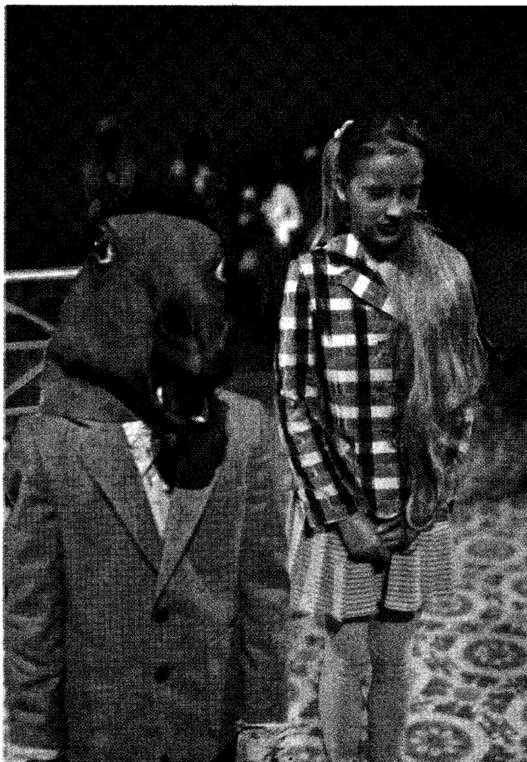
'Kind' door BonteHond, waarin intimiteit en loyaliteit tussen ouders en kroost bruut onderuit wordt gehaald.